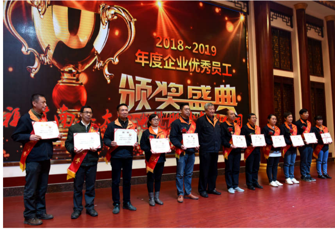
公司高管为优秀专卖店等先进集体及先进个人颁奖