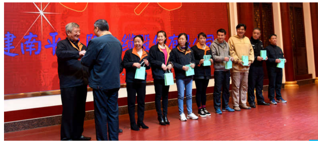
公司高管为获奖球队颁奖