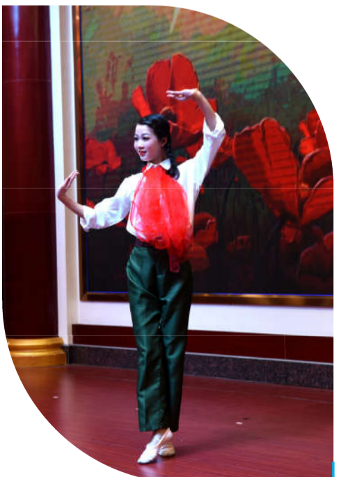
丰富多彩的晚会表演